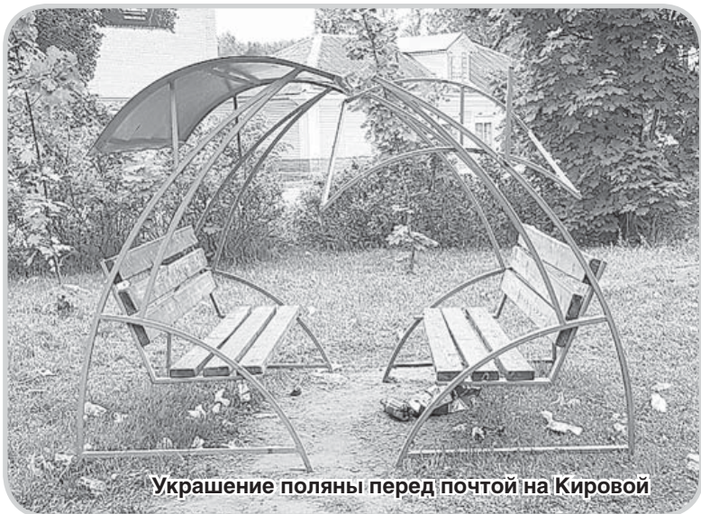
Украшение поляны перед почтой на Кировой

ТКО. Расшифровку этой аббревиатуры, думаю, теперь знают даже дети. Ведь к теме обращения с твердыми коммунальными отходами различные СМИ возвращаются постоянно. Вот и «Вестник» делает это тоже регулярно.